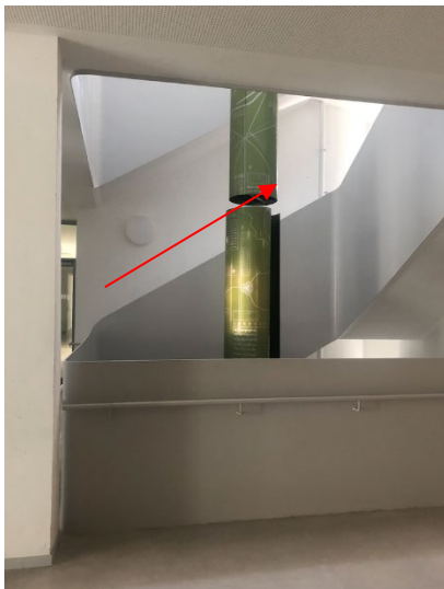
Treppenaufgang in der Mitte des Gebäudes

Nehmen Sie NICHT die Treppen direkt bei den Eingängen. Nur die mittlere Treppe führt zum Seminarraum im 2. OG.